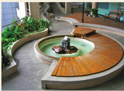
士商十景—幸福噴泉