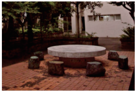
士商十景—中央花園-巧園