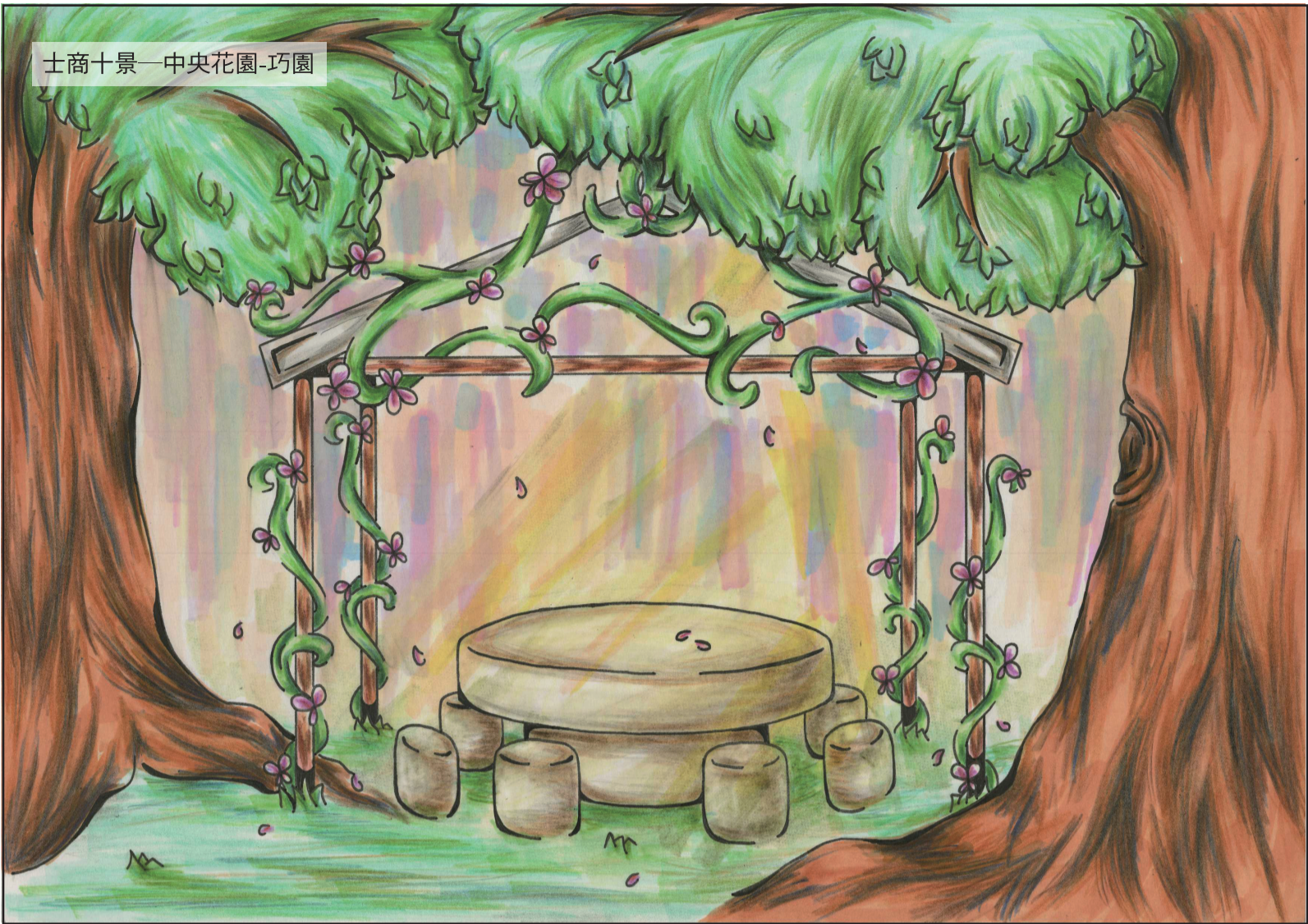
士商十景—中央花園-巧園